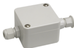
Gehäuse für Anschlusskabel