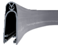
Sicherheitskontaktleiste elektrisch 8,2 kOhm (H 85 mm)