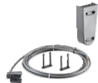
Endkappe (H 85 mm)